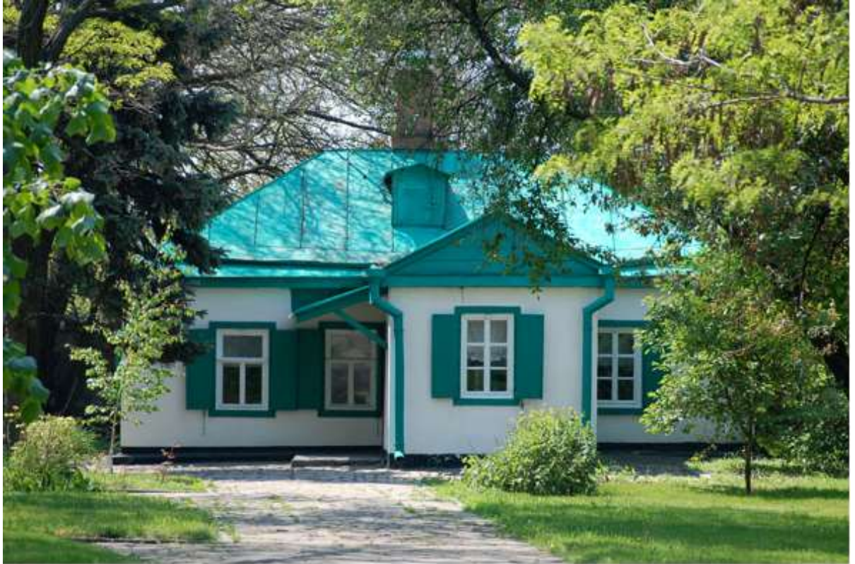
Дом Чеховых в Таганроге