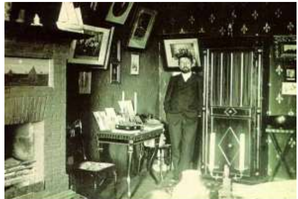
А.П. Чехов в Ялте

58. Александрина, М. "Домашний музей": [по чеховским местам теперь можно путешествовать в Интернете] / М. Александрина // Ежедневные новости. Подмосковье . – 2007. - 7 июня. – С. 2.