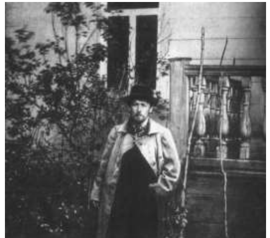
Чехов в Мелихово. 1892 г.

66. Бычков, Ю. Чеховский Гурзуф на полотнах А. Мишова : [о работе художника А. Мишова триптих "Чеховский Гурзуф"] / Ю. Бычков // Юный художник. - 2012. - № 1. - С. 41 – 43.