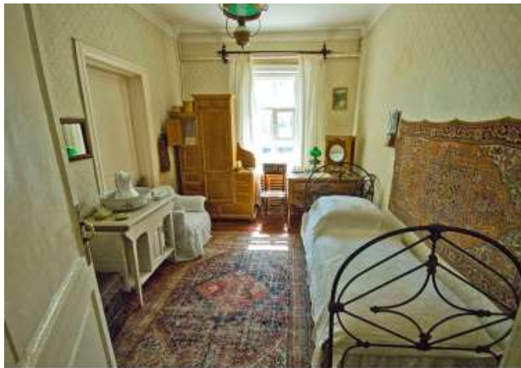
Мелихово. Комната А. П. Чехова