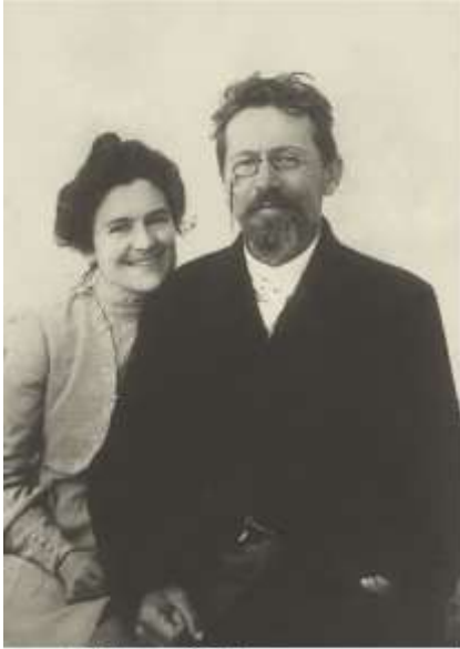
А. П. Чехов и О.Л. Книппер

«Хорошо вспомнить о таком человеке, тотчас в жизнь твою возвращается бодрость, снова входит в неё ясный смысл».