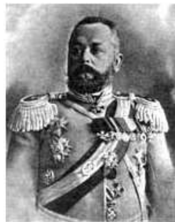
генерал А. В. Самсонов

В публикации идёт речь о судьбе командующего 2-ой армией генерала Александра Васильевича Самсонова.