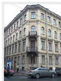
Дом, в котором находилась квартира Достоевского. Ныне здесь располагается музей писателя. Санкт-Петербург, Кузнечный переулок, 5/2.

61. Вайнерман, Виктор. Достоевский и Омск / Виктор Вайнерман // Москва. - 2006. - № 11. - С. 159 – 183.