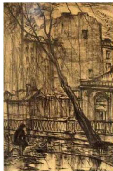
Иллюстрация И. Глазунова к повести Ф. М. Достоевского "Белые ночи."

42. Золотусский, Игорь Петрович. Сумасшедший выходит из подполья?: 200 лет Гоголя на фоне Достоевского: ["Записки сумасшедшего" Н. В. Гоголя и "Записки из подполья" Ф. М. Достоевского] / И. П. Золотусский, беседует Л. Аннинский // Родина. - 2009. - № 3. - С. 34 - 38.