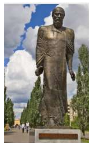
Памятник Ф. М. Достоевскому в Омске

113. Хотиненко, Владимир. "Времена перемен по-настоящему нас измучили":