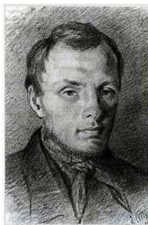
Достоевский в 26 лет, рисунок К. Трутовского, итальянский карандаш, бумага, (1847), (ГЛМ).

80. Нечаева, Вера Степановна. Ранний Достоевский: 1821 - 1849 / В. С. Нечаева ; Академия наук СССР, Институт мировой литературы им. А. М. Горького. - [Б. м. : б. и.]. - 287 с.